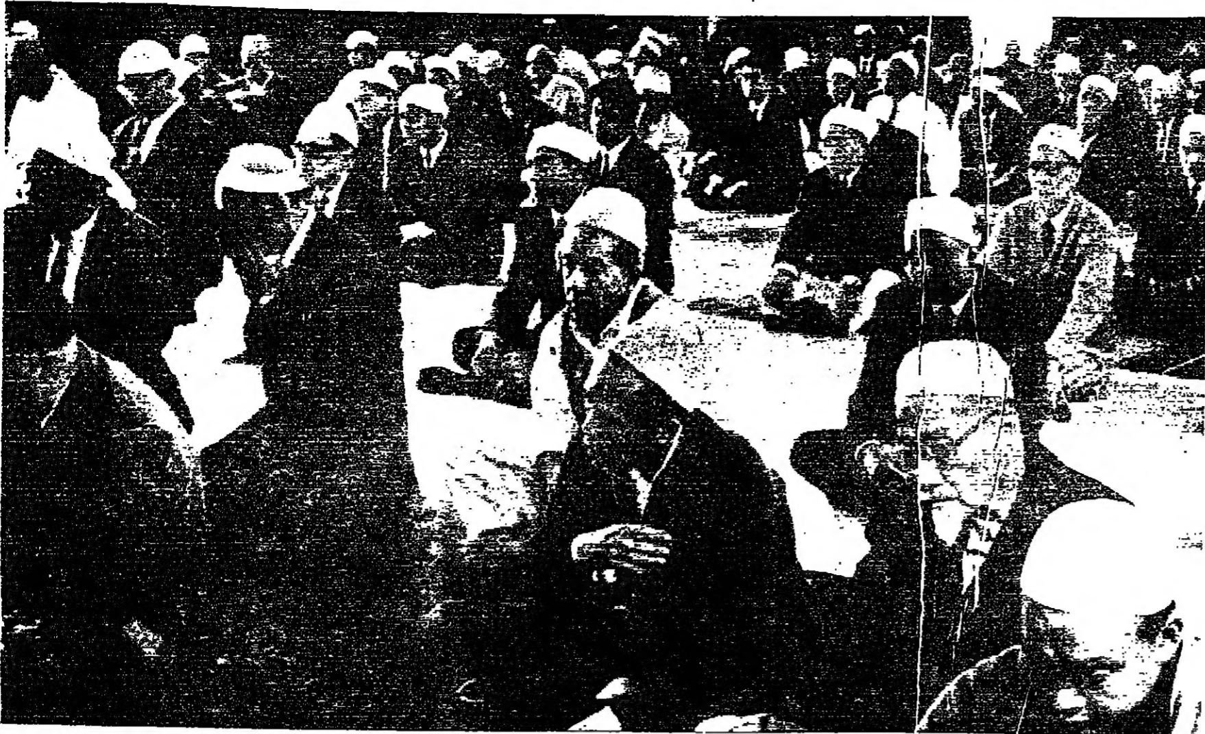
يعيش في هونغ كونغ نحو عشرة آلاف مسلم يؤدون شعائرهم الدينية في مسجدين كبيرين . وهم هنا يؤدون صلاة الجمعة في الجامع القديم الذي بني قبل تسعين عاما .